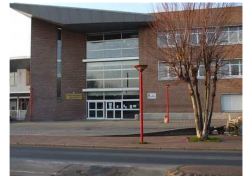
L'ATELIER SCIENCES POLITIQUES AU LYCEE ANDRE MALRAUX

59 avenue François Mitterrand 27 600 Gaillon Téléphone : 02 32 53 52 20 Télécopie : 02 32 53 96 84 Messagerie : ce.0271580W@ac-rouen.fr